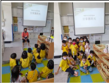
♥搭乘 孜煊阿嬤時光機 聆聽阿嬤的舊時光