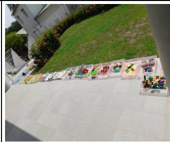
♥消滅病菌毒…教室清消、教具曝曬消毒