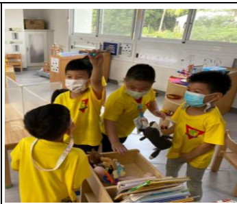
男生尋獲寶石成功