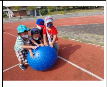
♥拼貼小永仁各班級及各教室空間鄰居