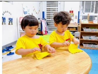
生活自理-(折抹布練習)