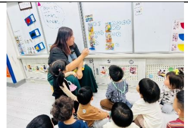
主題繪本扮演角色選擇